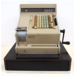
キャッシュレジスター