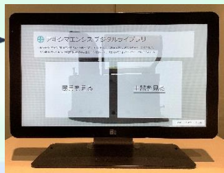
デジタルライブラリ