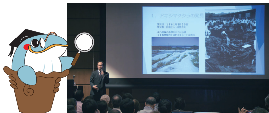
※写真は2018（平成30）年 あきしま緑花フェスティバル開催時の講演会の様子です。