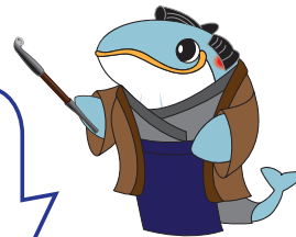
昭島市郷土資料室 公式キャラクター いさなちゃん

昭島市郷土資料室 〒196-0012 昭島市つつじが丘 3丁目3番15号 アキシマエンス 国際交流教養文化棟1階 TEL:042-543-1523 FAX:042-542-8002 (昭島市民図書館共通)